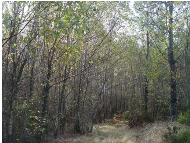
Fotografada em 14 de novembro de 2012: Proximidade geográfica do Cabeço da Neve.

Andresen, Sophia de Mello Breyner. O Cavaleiro da Dinamarca